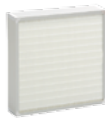
Filtermodul 2 (HEPA13)