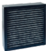
Filtermodul 3 (ACF)

Der Cairry ist standardmässig mit Staubfiltern ausgestattet. Wenn Sie mit dem Luftreiniger auch Gerüche und Gase filtern wollen, dann benötigen Sie das optionale Aktivkohle-Filtermodul.