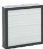
Filtermodul 1 (F7)